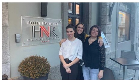
Les employés de l'hôtel National

Les Jeux olympiques de la jeunesse provoquent beaucoup d'animation dans la commune de Champéry. Dans le but de voir quel impact exactement les JOJ ont sur le tourisme de ce village, nous avons interrogé plusieurs gérants d'hôtels locaux. Par exemple, durant le week-end, l'hôtel National a eu 13 chambres sur 16 remplies par les familles des jeunes athlètes. A l'hôtel Suisse Champéry, la moitié des chambres sont prises par la fédération suisse de curling. Ensuite, nous sommes allées à l'office du tourisme et à la commune. Ils nous ont dit qu'il y avait une influence sur les commerces, car les personnes qui ne logent pas dans un