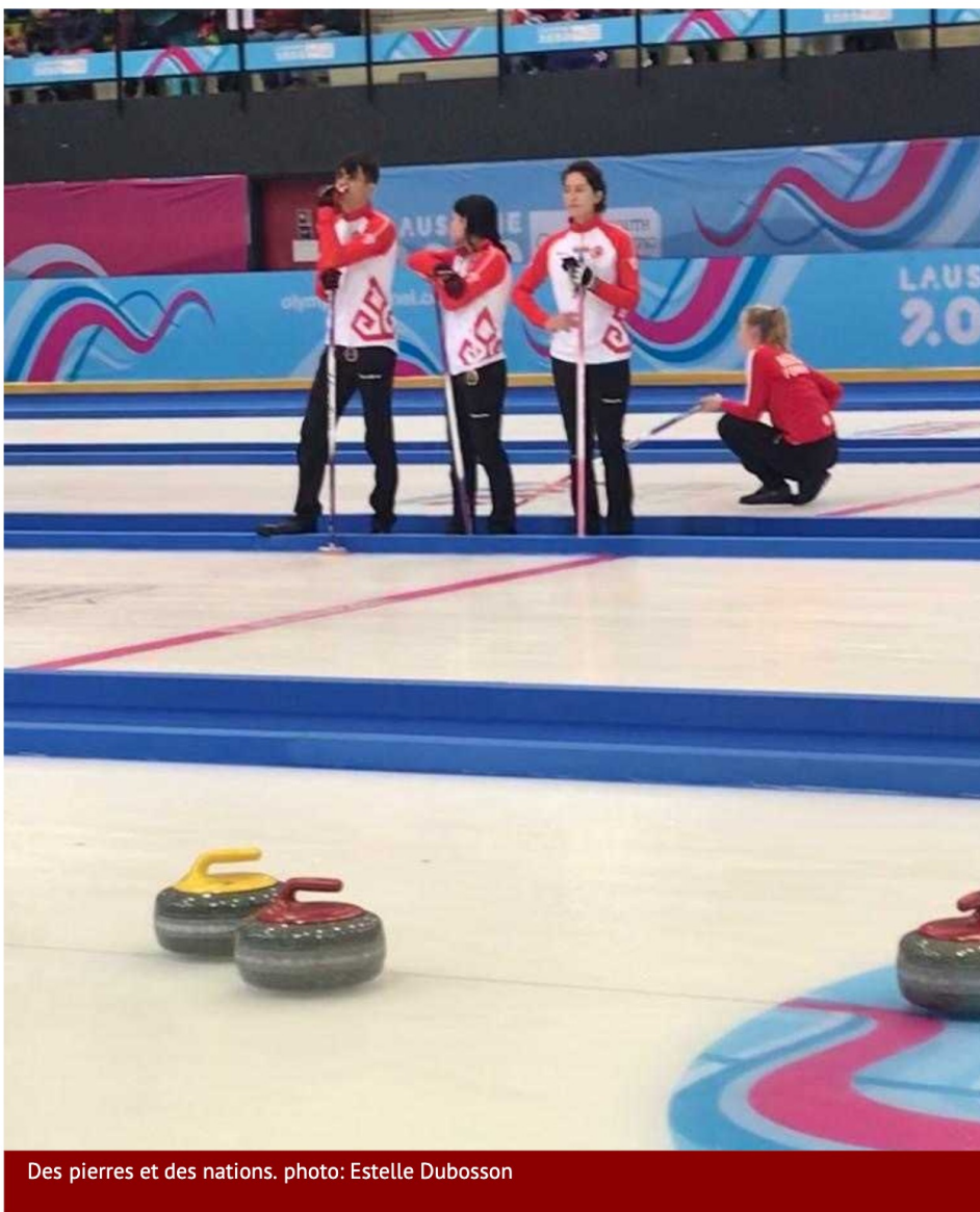
Des pierres et des nations.