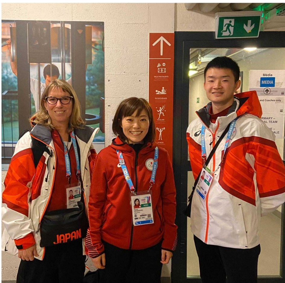
Coach japonaise au milieu, accompagnée par un membre de son équipe à droite et avec sa traductrice à gauche.

A Champéry, nous avons remarqué que la relation est amicale et surtout très forte. Le jeune sportif nous a précisé qu'en dehors des entraînements, ce n'est plus une coach qu'il a en face de lui, mais une amie. Ils font des activités diverses ensemble, tel que passer du temps à cuisiner en équipe, par exemple.