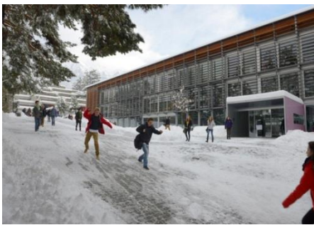
EC SPORT BRIG